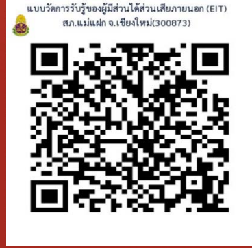
แบบวัดการรับรู้ของผู้มีส่วนได้ส่วนเสียภายนอก